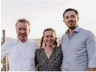
"Winemaking in perfection" 「完璧なるワイン造り」

ドナウ川沿いに続く美しい段々畑の景観が世界遺産にも指定された、オーストリア白の最高峰産地ヴァッハウ。伝統的なワイナリーが多いこの地にも、素晴らしい新世代ワイナリーが誕生しています。